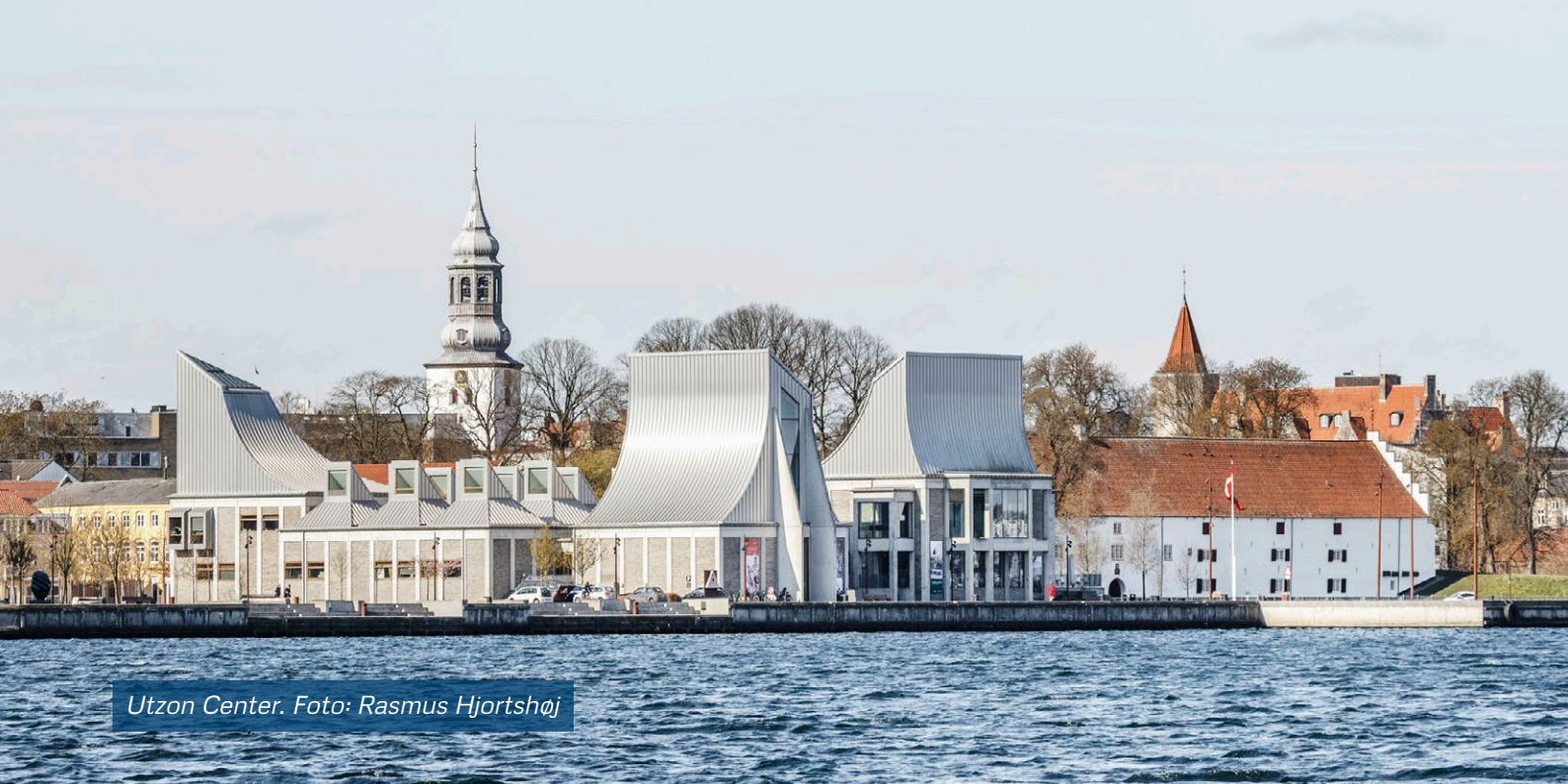
Utzon Center.